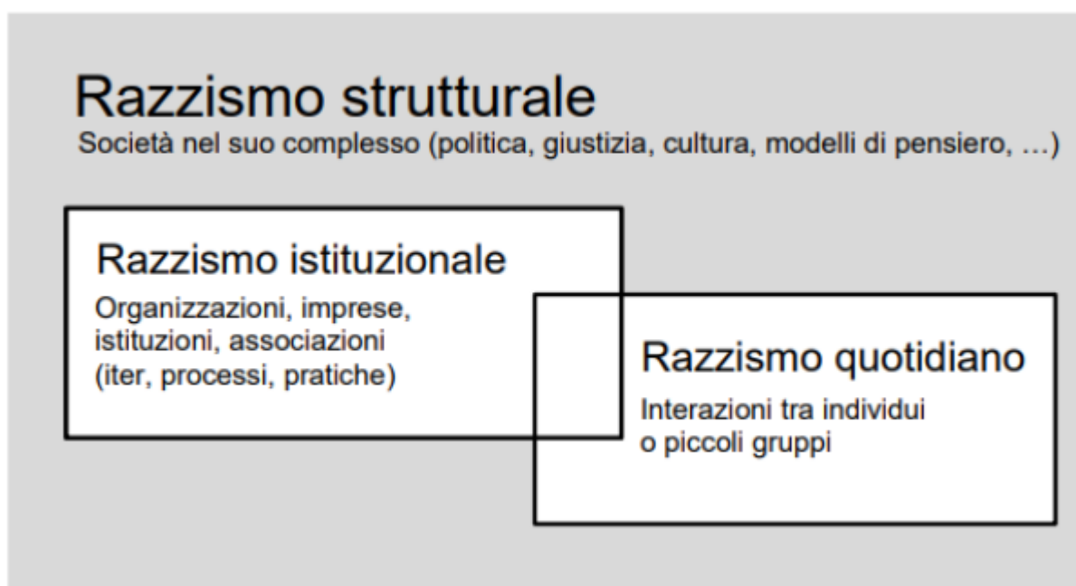
Figura 1 Manifestazioni del razzismo e della discriminazione razziale 15

Come si può dedurre dallo schema seguente, il razzismo si manifesta nella quotidianità e in tutti gli ambiti sociali su tre livelli: livello individuale o interpersonale, piano istituzionale e piano strutturale.